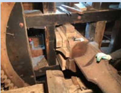
FOTO 1: HET BOVENWIEL IS HIER AL VERSTEVIGD TUSSEN DE KRUISARMEN, EEN VULSTUK IS UITGENOMEN OM OP TE SCHAVEN.

HET OUDE BOVENWIEL BEHOEFTE HERSTELWERKZAAMHEDEN. DOOR JARENLANG FUNCTIONEREN ZAT HET NIET VOLDOENDE STERK IN ELKAAR EN ZAT ER SPELING OP CRUCIALE VERBINDINGEN. OM ZO VEEL MOGELIJK VERVANGING TE VOORKOMEN IS HET BOVENWIEL UITVOERIG VERSTERKT EN IS SPELING OPGEVULD.