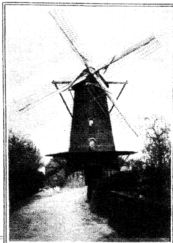
Op de bil. De molenaar is druk met de stenen