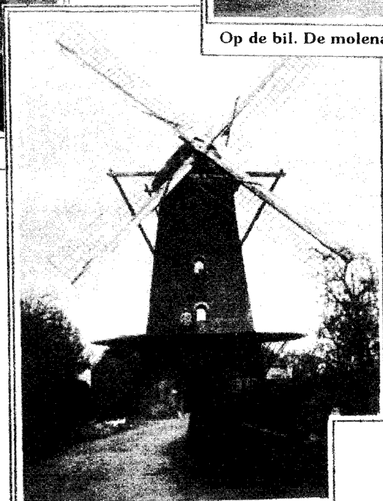
Nu vertellen de wieken: de molenaar heeft feest